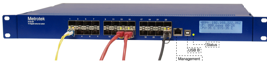
Рис. 4.1. Передняя панель коммутатора Metrotek X10-24

Примечание. Внешний вид передней панели коммутатора зависит от аппаратной модификации устройства и может отличаться от представленного на рис. 4.1. При этом назначение разъёмов и светодиодных индикаторов совпадает с описанием, представленным в табл. 4.1, 4.2 и 4.3.