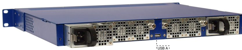
Рис. 4.2. Задняя панель коммутатора Metrotek X10-24

На задней панели коммутатора расположены: